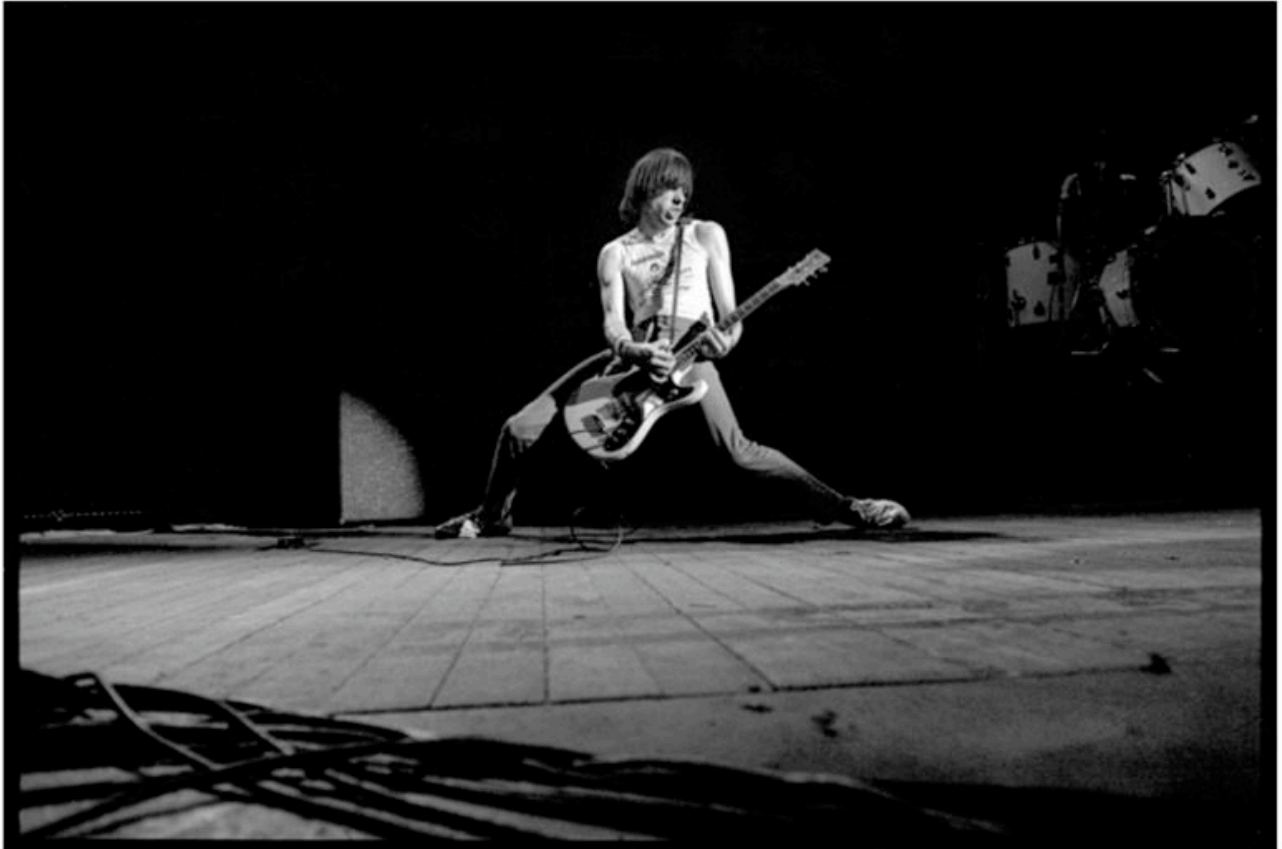
David Corio, The Ramones