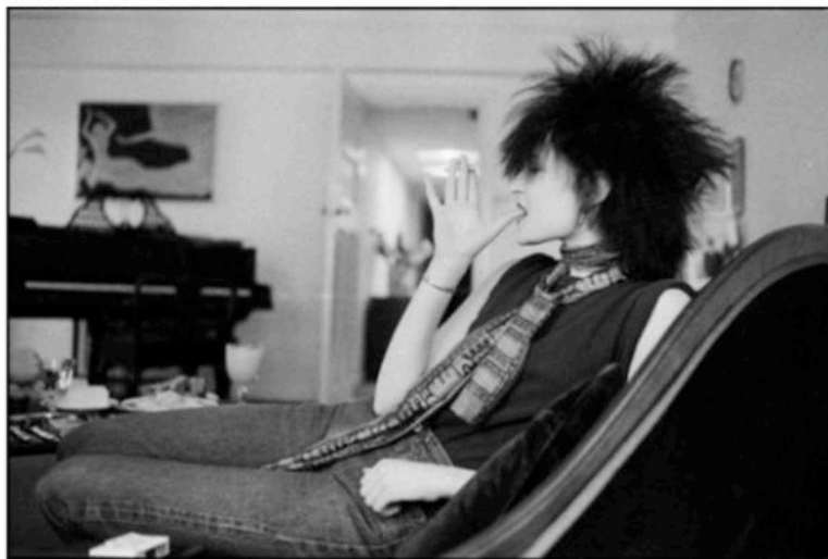
Siouxsie in her friend apartment - 1980