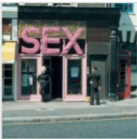
Sheila Rock – Outside Sex – 1974