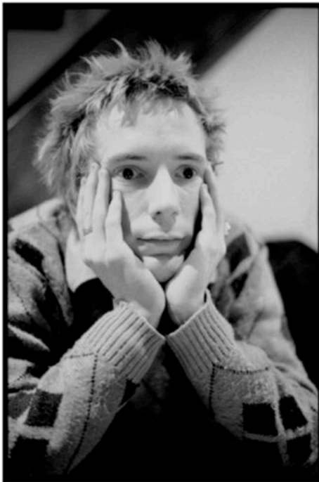
John Lydon, Johnny Rotten