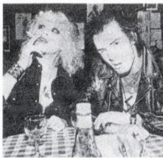
Sid & Nancy , simboli del punk

M illenovecentosettanta-sette-1980, tre anni spettinati, irriverenti e incazzati nei quali Londra chiama e il Punk risponde. Il «Sex» di Malcolm McLaren e Vivienne Westwood al 430 di King's Road che offre legna da ardere ai Pistols nel Giubileo d'Argento della regina Elisabetta II (God Save The