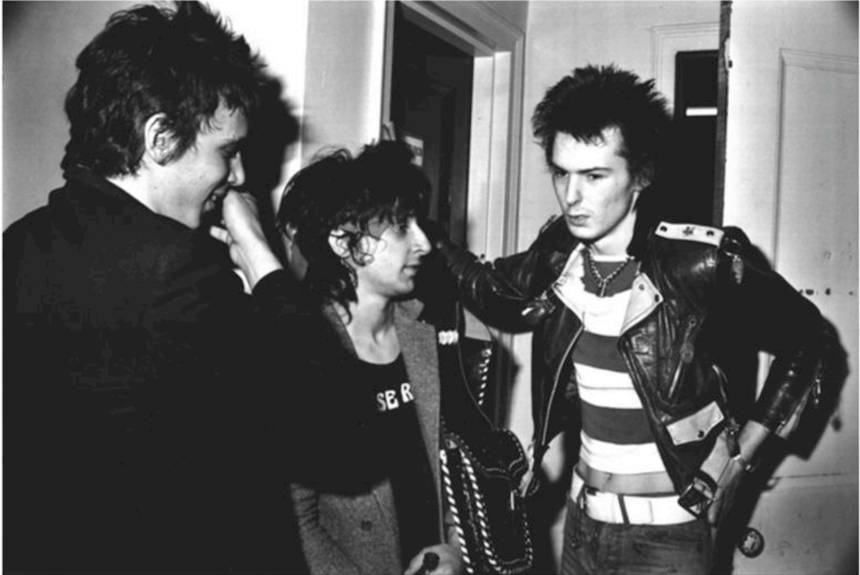
Sex Pistols, backstage al Palladium, 1978