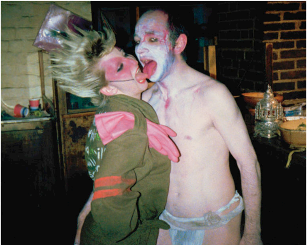
Six Jordan Jubilee Kiss