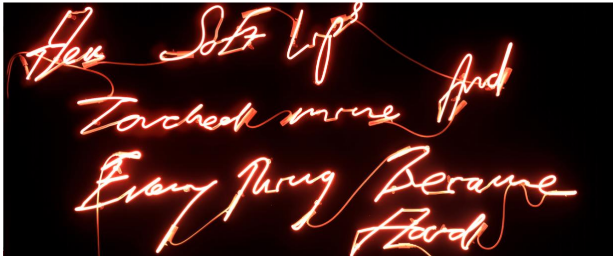
Tracey Emin, Her Soft Lips Touched mine And Every Thing Became Hard , neon, 2008

Con questa mostra Marco Orler offre un'occasione unica per immergersi nelle visioni di queste artiste e cogliere l'opportunità di riflettere sull'evoluzione dell'arte attraverso l'obiettivo femminile .