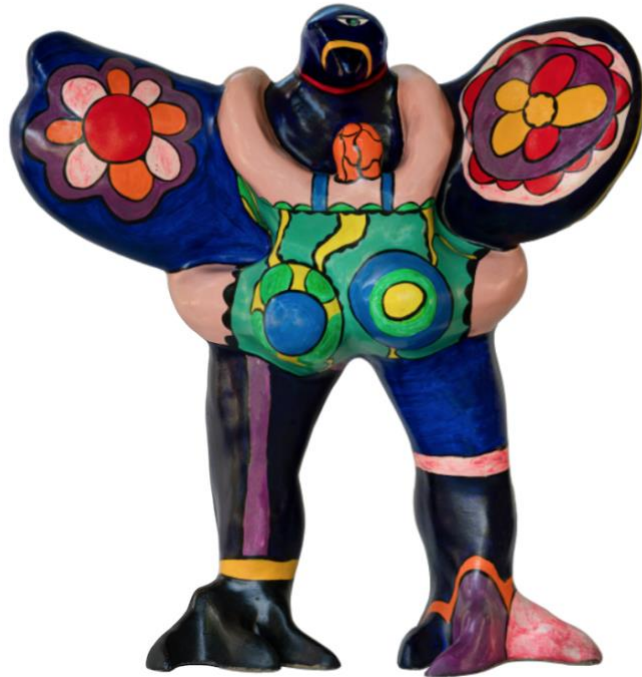
Niki de Saint Phalle, Oiseau amoureux, dipinto su resina, 1972

poliestere. Le sue opere sono presentate nei più importanti musei del mondo tra i quali Metropolitan Museum of Art di New York, Musée d'Art Contemporain di Marsiglia, Museo Stedelijk di Amsterdam, Tate Gallery di Londra.