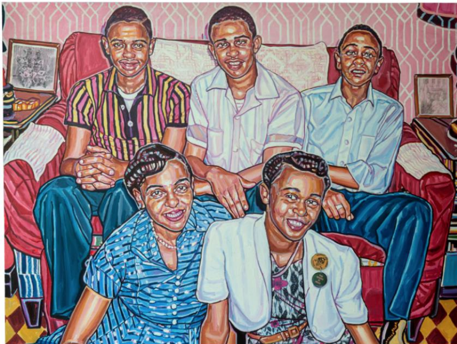
Esiri Erheriene-Essi, The Memory Keepers, olio inchiostro e xerox trasferito su lino, 2023