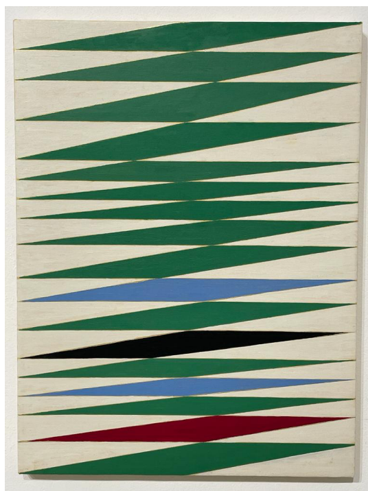
Canal Grande (rouge et noir) di Andrew Holmes Huston