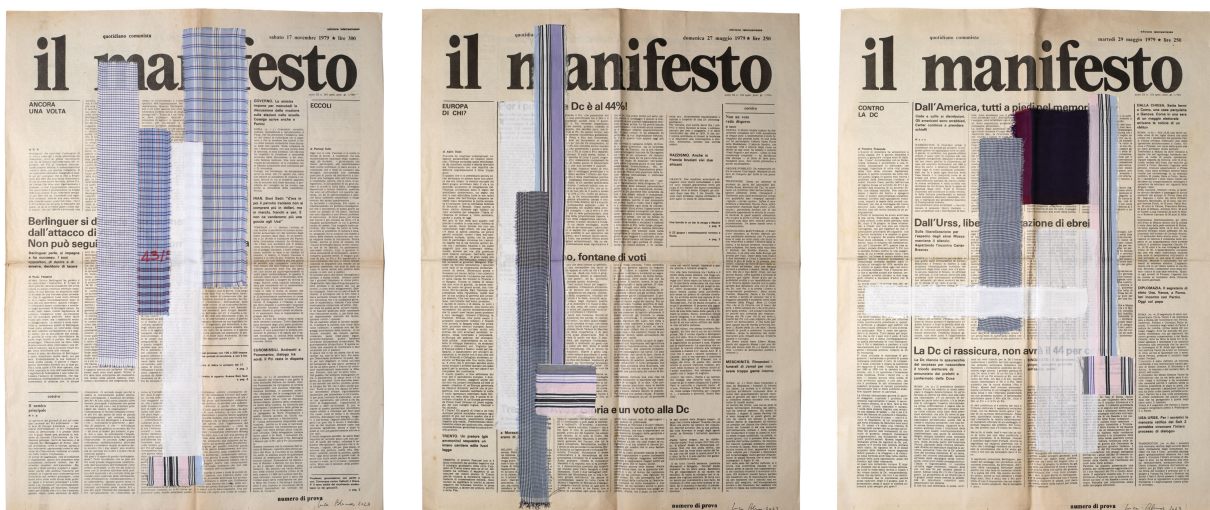
"Numero di prova 1" di Luca Blumer

Quest'anno infatti per la prima volta do ut do darà spazio a nuovi volti del panorama artistico contemporaneo. Per l'occasione, Luca Blumer esporrà la sua opera " Numero di prova 1 ", Trittico del quotidiano "Il manifesto" della fine degli anni '70 su cui sono applicati tessuti di cotone. L'opera si chiama "Numero di prova", una dicitura che l'editore usava per identificare alcuni numeri del giornale.