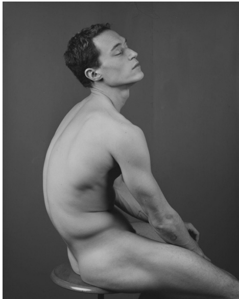
Ettore Moni, Albert, 2024, fotografia analogica, 60 x 72 cm

appartenenza. Ogni scatto permette di rispecchiarsi nell'altro, ampliare i nostri orizzonti e trovare legami condivisi.